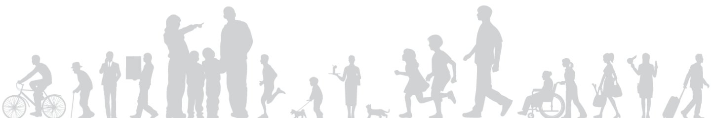
加覧 伸一 九州・沖縄地域事業本部 鹿児島支店